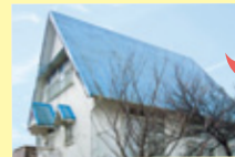
リフォーム前 (化粧スレート葺)

まずは塗り替えなどのメンテナンスの手間も費用もほとんど不要、経年劣化がなくいつまでも美しさが失われないのがいいですね。